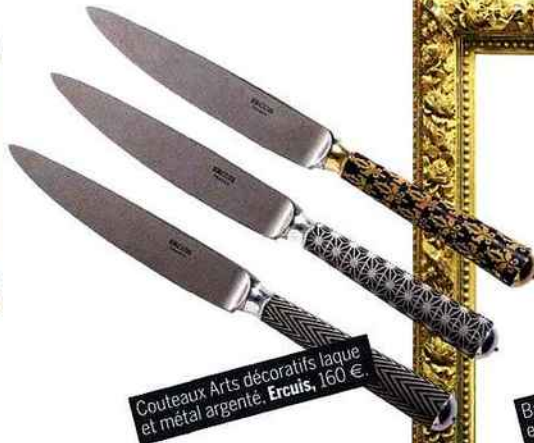
Couteaux Arts décoratifs laque et métal argenté. Ercuis , 160 €.