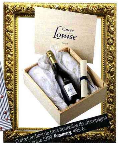
Coffret en bois de trois bouteilles de champagne Cuvée Louise 1999. Pommery , 495 €.