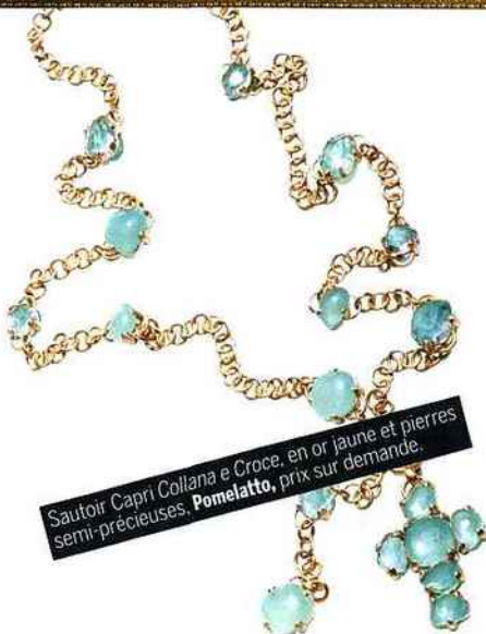
Sautoir Capri Collana e Croce, en or jaune et pierres semi-précieuses. Pomellato , prix sur demande.