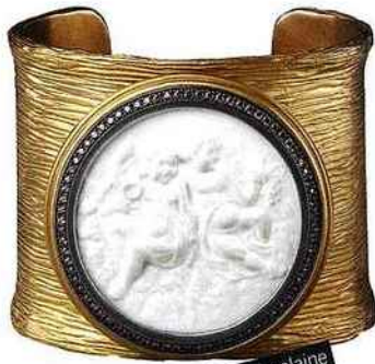
Manchette en vermeil et porcelaine biscuit. Bottega Veneta , 2950 €.