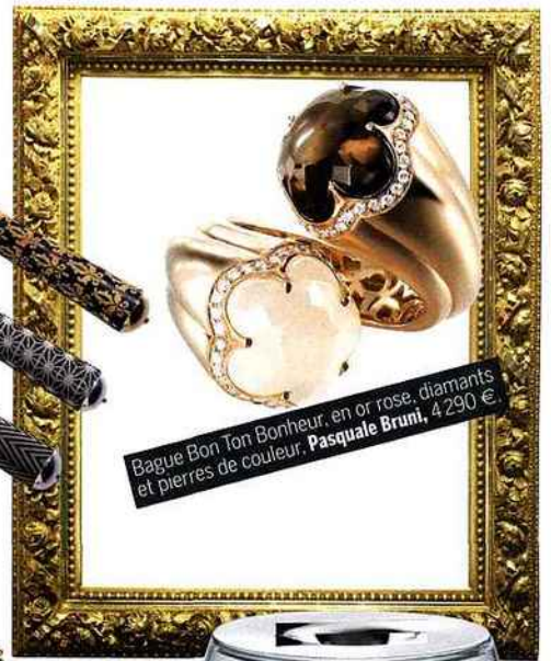
Bague Bon Ton Bonheur, en or rose, diamants et pierres de couleur. Pasquale Bruni , 4 290 €.