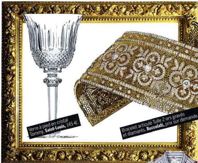
Verre à pied en cristal Tommy. Saint-Louis , 145 €.