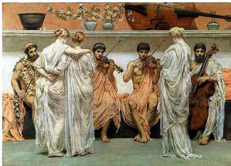
* Exposition « Désirs et volupté », musée Jacquemart André, jusqu'au 20 janvier 2014.

LE QUARTET. HOMMAGE DU PEINTRE À L'ART DE LA MUSIQUE. ALBERT MOORE, 1868. HUILE SUR TOILE. 61,8 X 88,7 CM. COLLECTION PÉREZ SIMÓN. MEXICO.