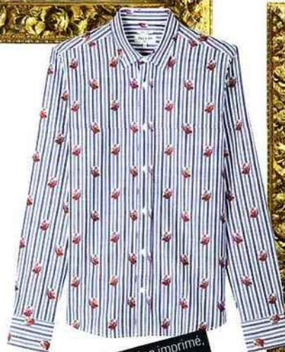
Chemise en coton imprimé. Paul & Joe , 235 €.