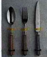
TABLE ÉTOILÉE Les couverts et pièces de service de la nouvelle collection Arts décoratifs signée ERCUIS font écho à l'Exposition internationale de 1925 (à Paris), à laquelle l'orfèvre participa. En laque d'une extrême brillance (déclinée en trente couleurs), ils sont gravés de l'un des huit motifs guillochés et argentés et dorés avant assemblage. Cuillère ou fourchette, 170 € ; couteau, 160 €.

✓ 8 bis, rue Boissy-d'Anglas, 75008. www.ercuis.com