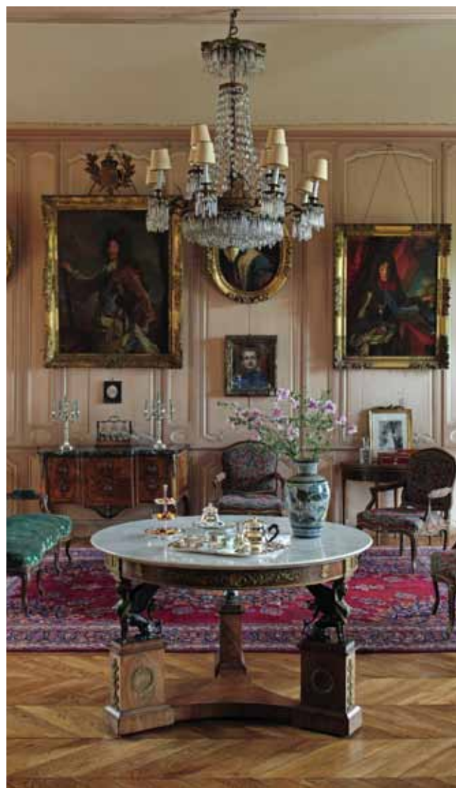
✿ Ercuis 茶具从最细节处提供最优质的银质器皿

继承了古老和独特的银器制作技术，也同时禀赋现代尖端制作工艺，而又从未停止创新思维，Ercuis当之无愧荣获了法国“充满活力的遗产企业”称号。Ercuis将传统与创新、技术与发明、工作与激情、本地与国际、遗产与未来融合一体，无与伦比。