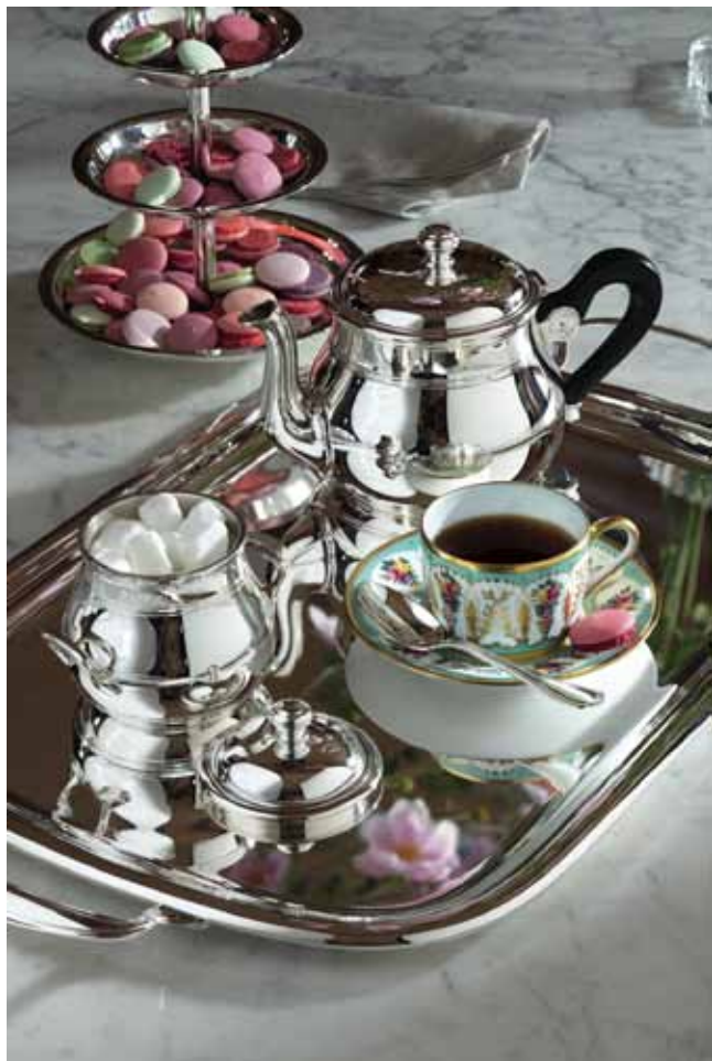
✧ Calebasse 系列咖啡茶具银光流转