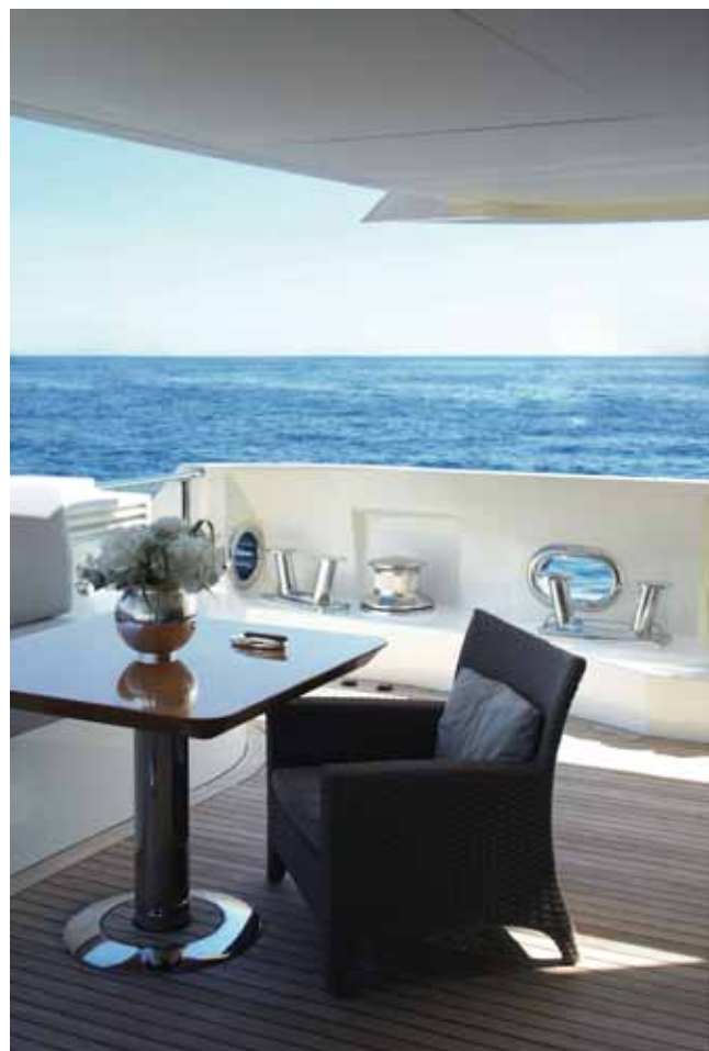
▲摩纳哥停靠在岸边的私人游艇哈桑，Transat系列的香槟冰桶、烛台 Galet系列的雪茄烟缸和Calypso系列的相框