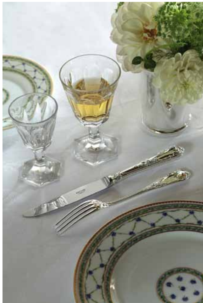
✧ 在 Perigod 地区私人城堡的餐厅, 餐桌上摆放的 Rocaille 系列