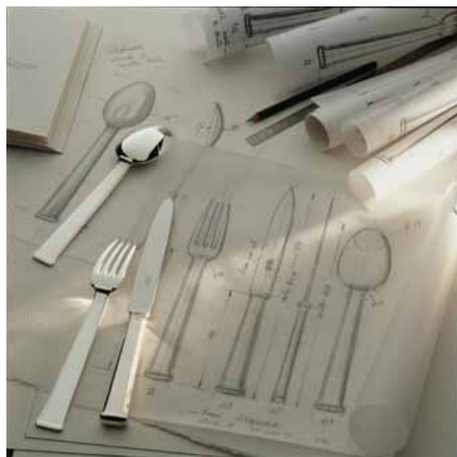
✿ 每一款餐具都经过精湛设计，亦可根据客户需求提供高端定制