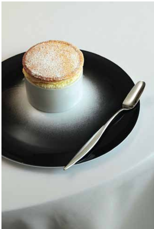
✿ 顶级酒店和餐厅都有 Ercuis 的低调银光闪亮，餐具、美食、美景浑然天成