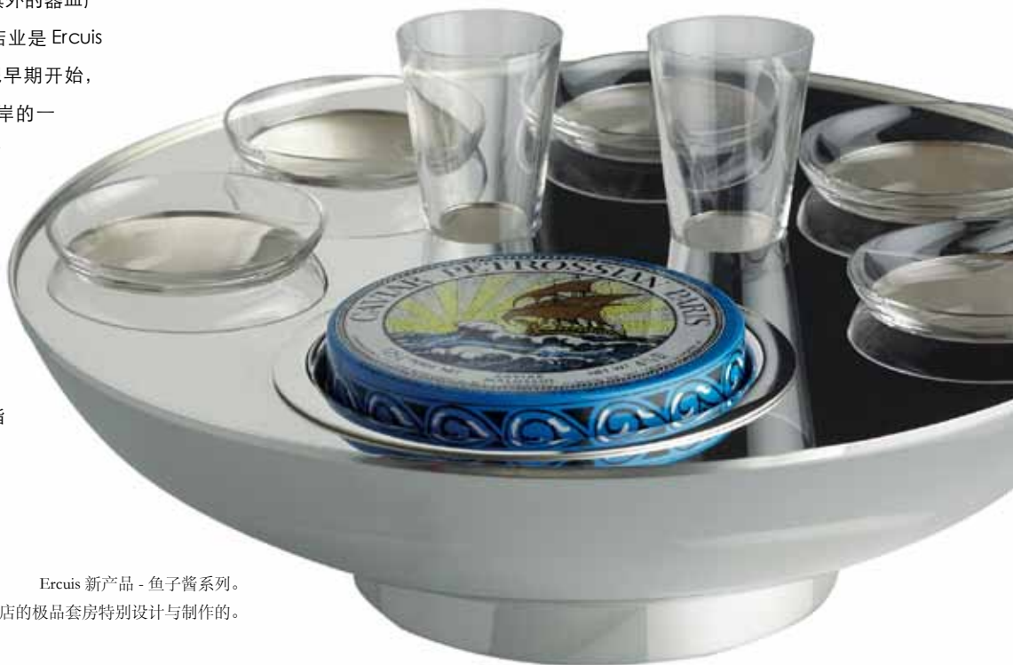
Ercuis 新产品 - 鱼子酱系列。